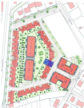
SITUATION DU LOT